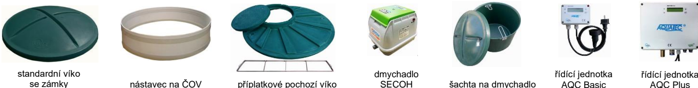
standardní víko se zámky

Firma Aquatec USBF s.r.o. si vyhrazuje právo na změnu výše uvedených cen.